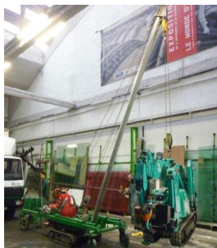
Levage: 1 T 700