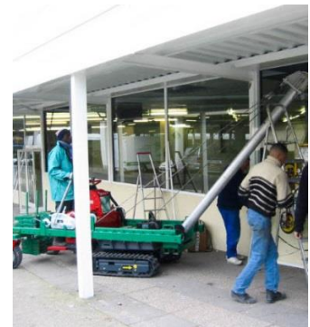
Pose sous casquette: