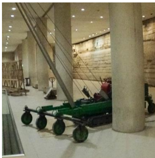
Avec le bélier: